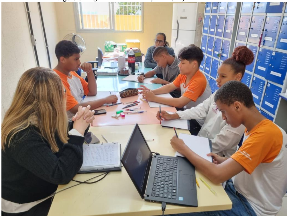
Figura 3. Registros da intervenção do projeto de extensão