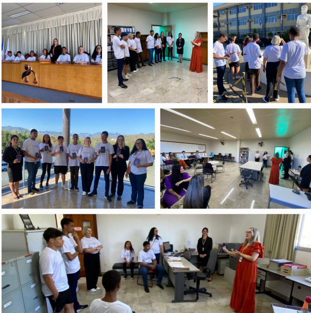
Figura 6. Registros da intervenção do projeto de extensão