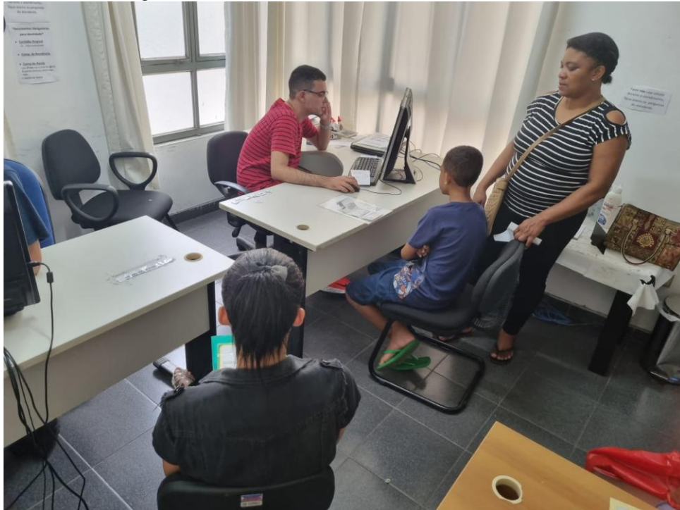
Figura 4. Registros da intervenção do projeto de extensão