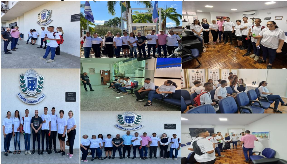
Figura 2. Registros da intervenção do projeto de extensão

Relevância à Sociedade: O projeto é relevante para a sociedade, pois contribui para a promoção de uma educação mais humanizada e democrática, capacitando os estudantes não apenas academicamente, mas também para uma participação ativa e responsável na sociedade. Ao criar um ambiente escolar seguro e inclusivo, o projeto ajuda a formar cidadãos conscientes e empáticos, que poderão contribuir para a construção de uma sociedade mais justa, igualitária e pacífica.