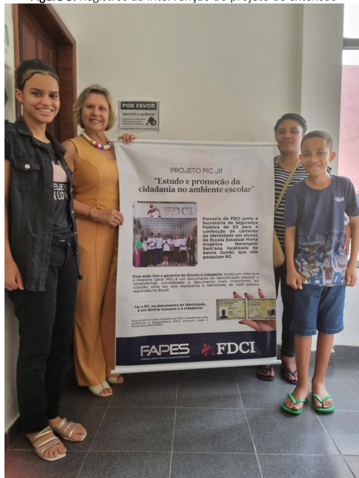
Figura 5. Registros da intervenção do projeto de extensão