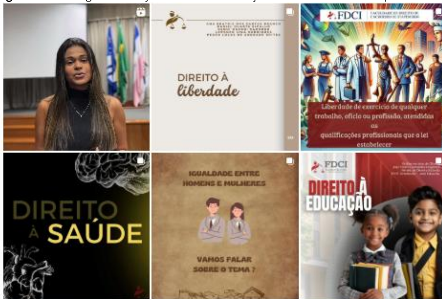
Figura 2. Perfil digital do Projeto de Curricularização da Extensão “Direito para todos!”