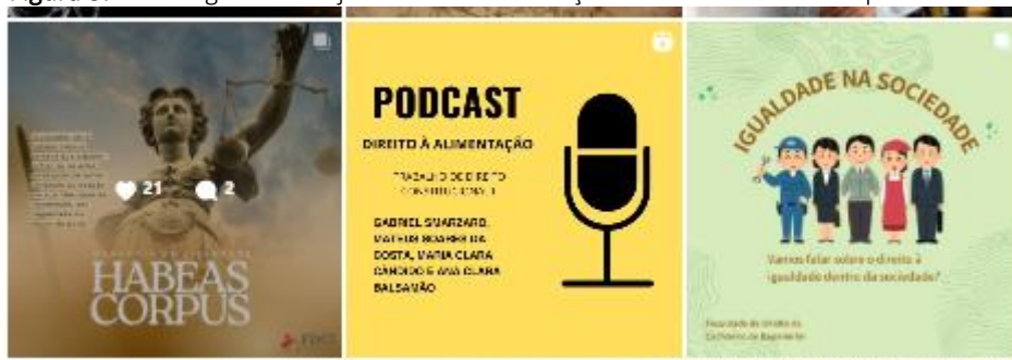
Figura 3. Perfil digital do Projeto de Curricularização da Extensão “Direito para todos!”