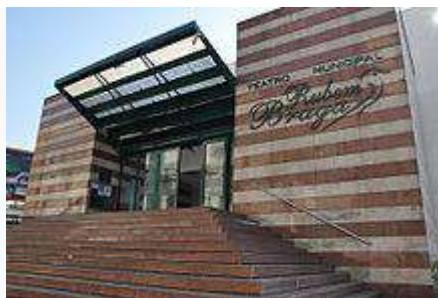
Fachada do Teatro Municipal Rubem Braga.

A cidade de Cachoeiro de Itapemirim já contou com vários outros espaços para a cultura, porém o atual é o Teatro Municipal Rubem Braga. Já passaram vários atores e cantores nacionalmente reconhecidos.